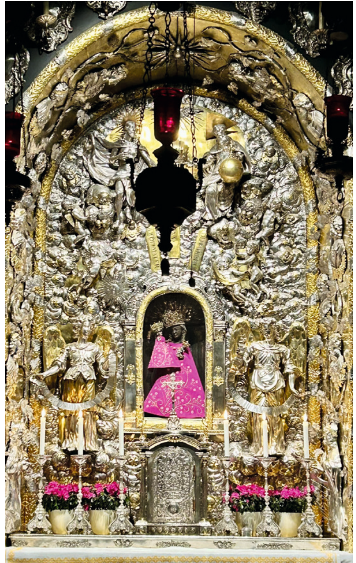
Madonna von Altötting in der Wallfahrtskirche