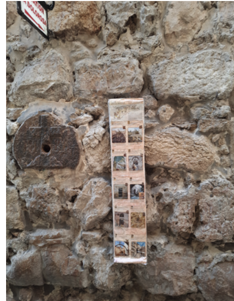
Via Dolorosa in Jerusalem