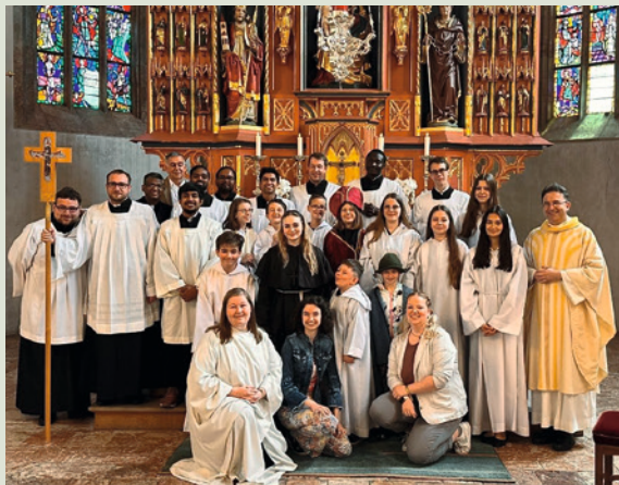
Fest für den Hl. Wolfgang