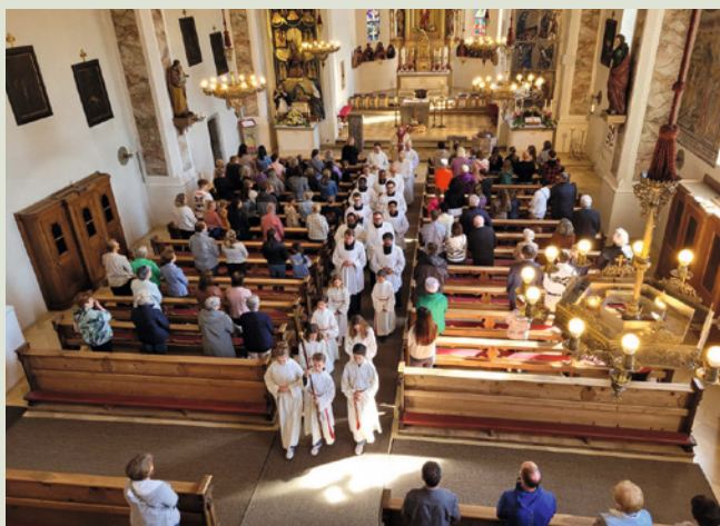
Zu Gast in Fügen im Zillertal