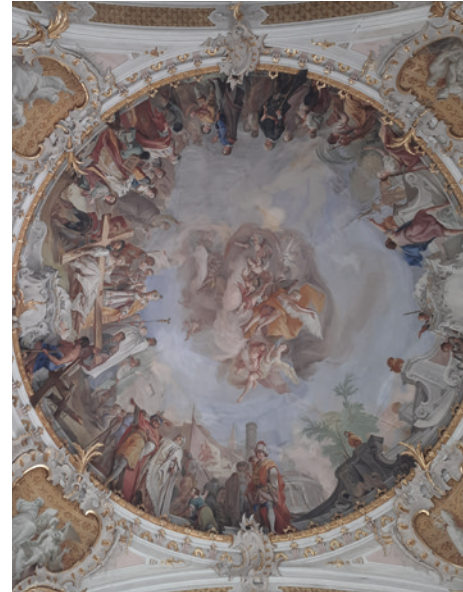
Deckenfresco – Kreuzesauffindung durch die Hl. Helena

hinzugefügt. So wuchs Bedeutung des Kreuzweggebetes. Das Kreuz ist ein Heilszeichen für uns Christen. Jesus hat uns durch seinen Tod am Kreuz von den Sünden befreit. Er trug das Kreuz durch die Stadt Jerusalem und nahm alles Leid für die Sünden der Welt auf sich. Diese Liebestat, die er für uns getan hat, haben viele Pilger im Heiligen Land in den vergangenen Jahrhunderten durch Nachahmung des Kreuzweges in Jerusalem geübt, damit diese besondere Tat Jesu im Gebet angerufen werden kann. Der Kreuzweg ist eine besondere Möglichkeit, sich dem Leiden Jesu zu nähern und einen Weg der Hoffnung zu erfahren. Er ist ein Weg zur Erlösung, auf dem man die Leiden Jesu mitgehen kann, und es ist eine Einladung, dieses Ereignis zu verstehen und seine Liebe zu uns zu begreifen. Diese Form des Gebetes kann uns heute etwas Wichtiges zeigen: Er gibt uns zu verstehen, wie Jesus gelitten