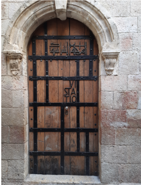
6. Station der Via Dolorosa in Jerusalem