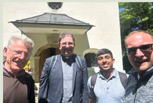
Wallfahrt nach Maria Brettfall

Am 22. Juni fand der letzte Einkehrtag und zugleich die Abschlusswallfahrt für das Studienjahr 2023/24 statt. Der Weg zur Kirche, die der Hl. Magdalena geweiht ist, war immer wieder unterbrochen von Impulsen unseres Spirituals. Oben angekommen folgte die feierliche Messe gemeinsam mit den anderen Gläubigen.