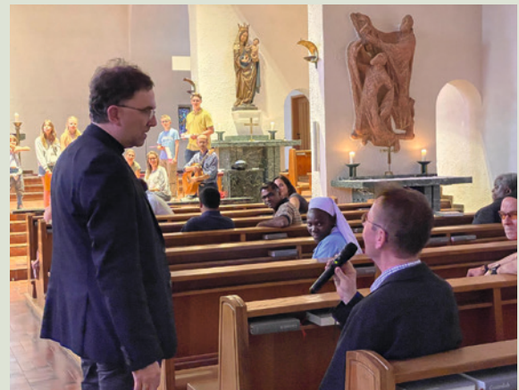
Lange Nacht der Kirchen

Zum ersten Mal nahm heuer auch das Priesterseminar an der Langen Nacht der Kirchen teil. Nach einer musikalischen Eröffnung durch den Kinderchor St. Paulus gab es im Garten die Möglichkeit, sich auf dem Volleyballplatz auszutoben, einen Besinnungsweg zum Thema Herz Jesu zu gehen oder die kulinarischen Köstlichkeiten vom Grillrost zu genießen. Den Abschluss bildete wiederum eine Andacht in der Seminarkirche.