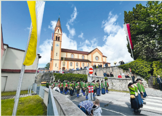
Pfarrbesuch in Telfs