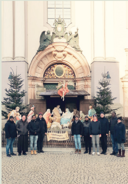
Exerzitien in Althötting

Die gemeinsame Zeit in Altötting zum Einkehren und sich Einstimmen auf das Weihnachtsfest war eine willkommene Auszeit für die Seminaristen, bevor es für sie ins Pfarrpraktikum zu den Feiertagen ging.